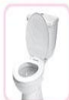
افزایش دفع ادرار