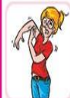
خشکی و خارش پوستی