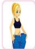
از دست دادن وزن