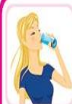
احساس تشنگی فراوان

تهیه کننده: گروه آموزش به بیمار پاییز ۱۳۹۵