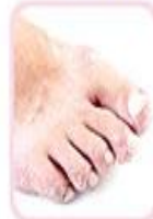
گندی پیود زخم